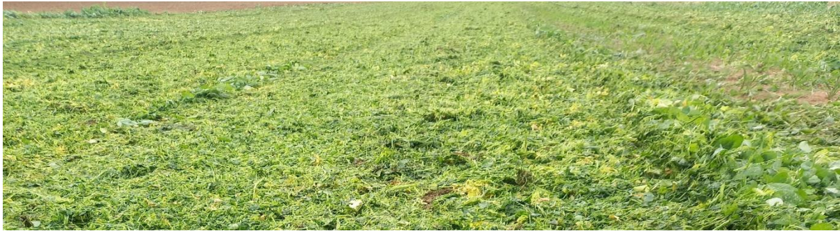
Malčirani grašak kao pokrovni usev

Azot (N) je elemenat kojim je najteže upravljati u poljoprivredi, obzirom da su mnogi njegovi oblici u zemljištu veoma pokretljivi i teško ih je zadržati, tako da se velike količine N gube i završavaju u vazduhu ili podzemnim vodama: ispiranjem nitrata ( \text{NO}_3^- ), isparavanjem amonijaka ( \text{NH}_3 ), kao i denitrifikacijom \text{NO}_3^- u gasoviti azot ( \text{N}_2 ). Leguminoze kao pokrovni usevi (detelina, grahorica, grašak, soja) imaju sposobnost fiksacije atmosferskog N u zemljište, pri čemu se smanjuje potreba za mineralnim đubrivima. Može se reći da pokrovni usevi pomažu u očuvanju N u sistemima gajenja, smanjujući njegove gubitke i obezbeđujući dobru zalihu neorganskog N u momentu potrebe glavnih useva za ovim elementom. Pokrovni usevi sa dubokim korenom usvajaju hranljive materije iz dubljih slojeva zemljišta, čineći ih dostupnim za naredni usev. Jedna od veoma važnih funkcija pokrovnih useva jeste mogućnost “blokiranja” N u zemljištu ili biljnom materijalu u momentu kada glavni usev nema potrebu za ovim elementom, čuvajući ga na taj način od ispiranja.