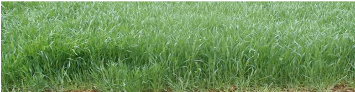
Pokrovni usev ozime raži

Pokrovni usevi su u vegetativnoj fazi efikasniji u suzbijanju korova od njihovih ostataka, dok su ostaci pokrovnih useva značajniji u smanjenju nicanja korova na početku vegetacionog perioda. Istraživanja potvrđuju da su biljni ostaci raži kao pokrovnog useva (živi malč), obezbedili skoro potpunu kontrolu svih uobičajenih korova u narednom usevu soje (smanjenje korova za 75% u poređenju sa parcelom bez malča).